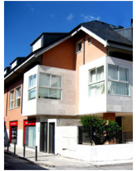
C/ Real 31, - 28250 Torrelodones, Madrid

SUPERFICIE CONTRUIDA: 192 m 2 TIPO DE CONSTRUCCIÓN: Local comercial NÚMERO DE PLANTAS: Planta 1 de 1 PRECIO ALQUILER: A consultar